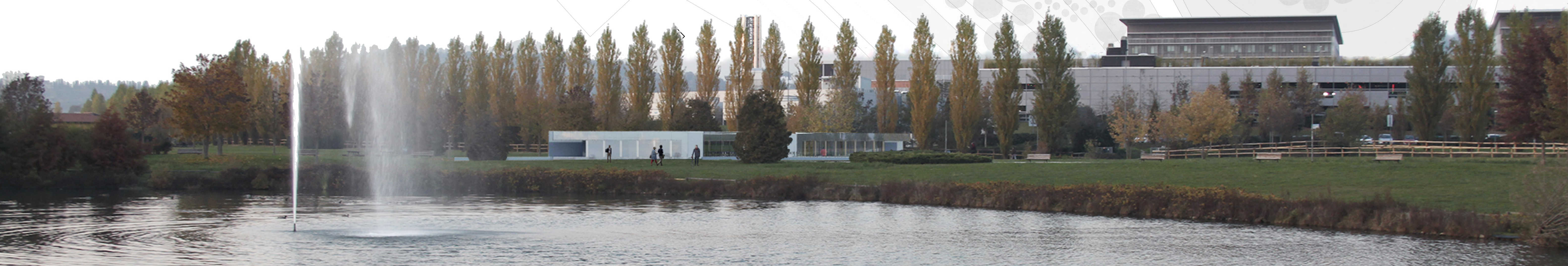
Assesti morfologici del paesaggio