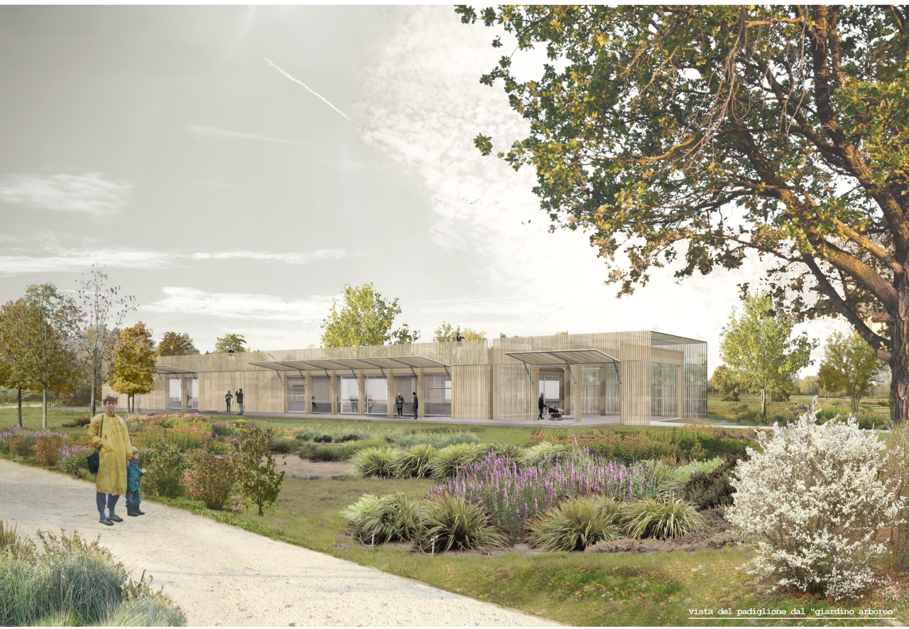
vista del padiglione dal "giardino arboreo"

deck esterno e tetto verde sono pensati come spazi pubblici del parco, accessibili, flessibili e adibiti all'estensione del bar/ristorante nella stagione estiva