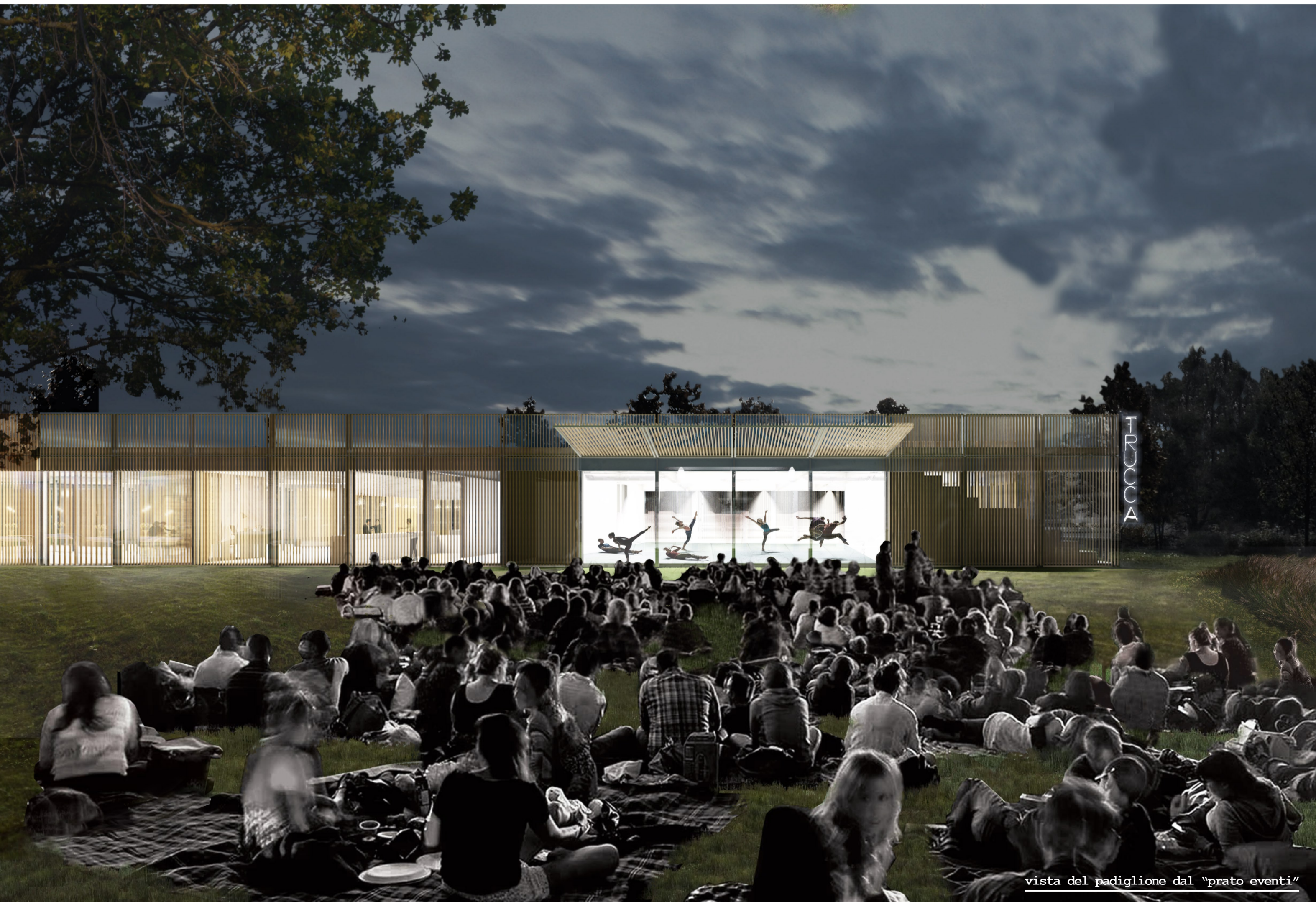
vista del padiglione dal "prato eventi"