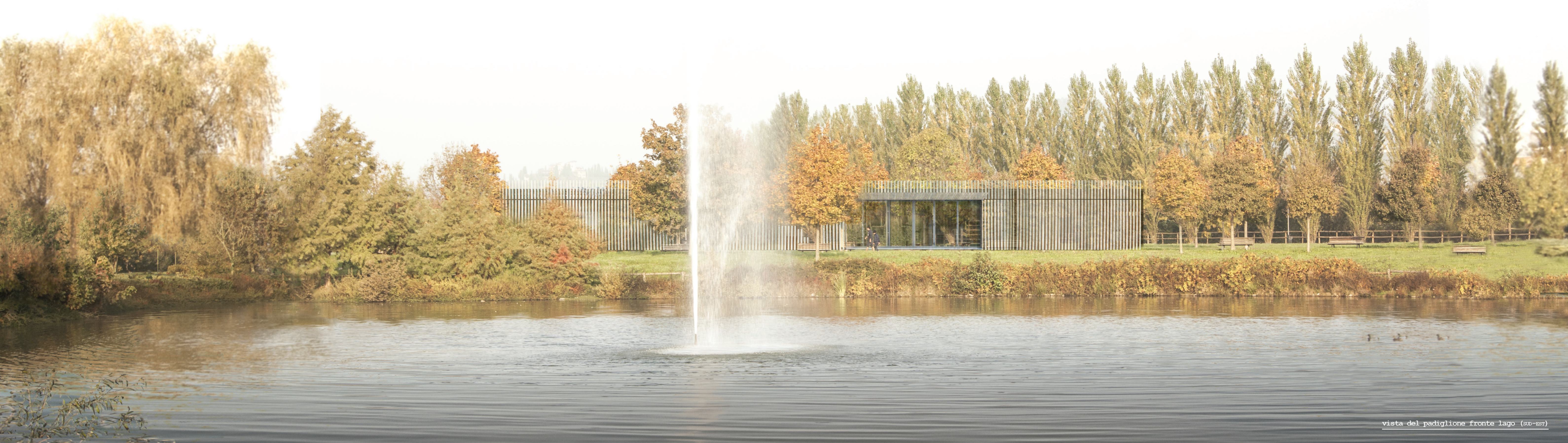
vista del padiglione fronte lago (SUD-EST)